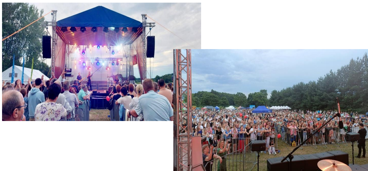
Festyn gminny „Gmina Sarnaki Się Bawi!”