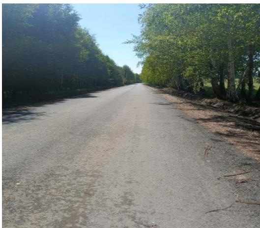
in w miejscowości Rozwadów

Dzięki wykonaniu nawierzchni bitumicznej na tej drodze zmniejszą się bieżące koszty utrzymania drogi.