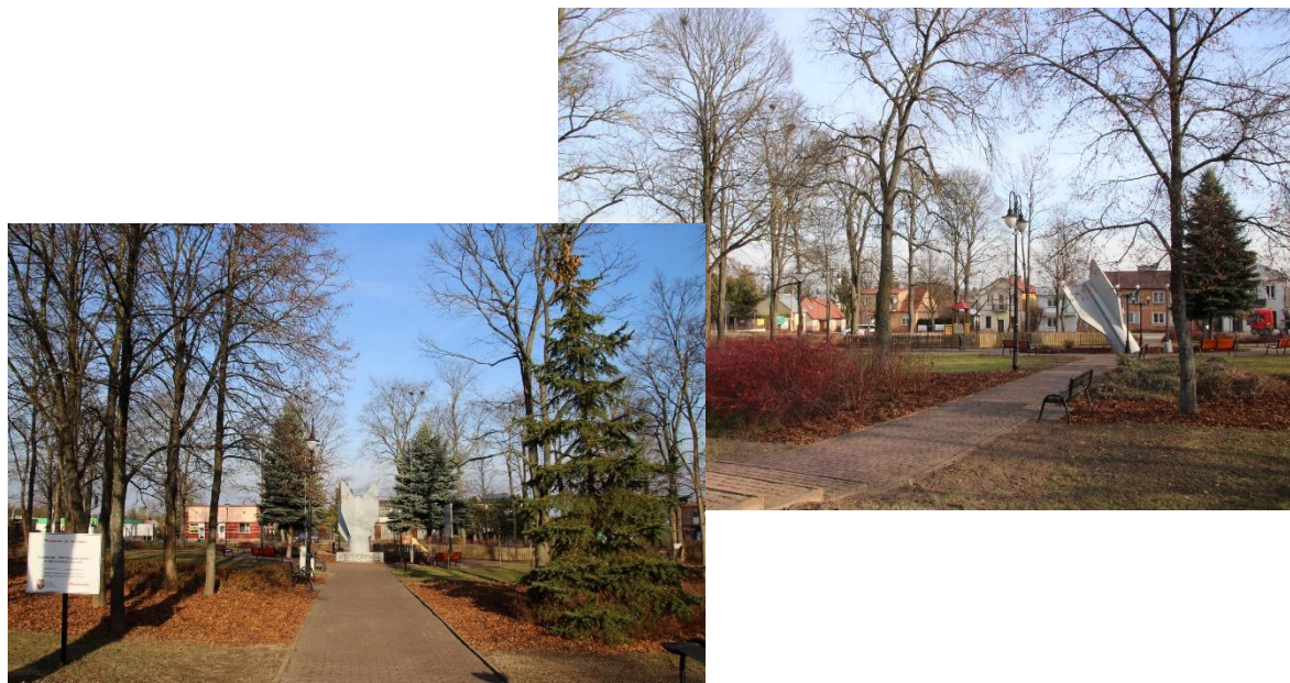
Park w miejscowości Sarnaki

W ramach projektu przeprowadzono pielęgnację drzew na skwerku.