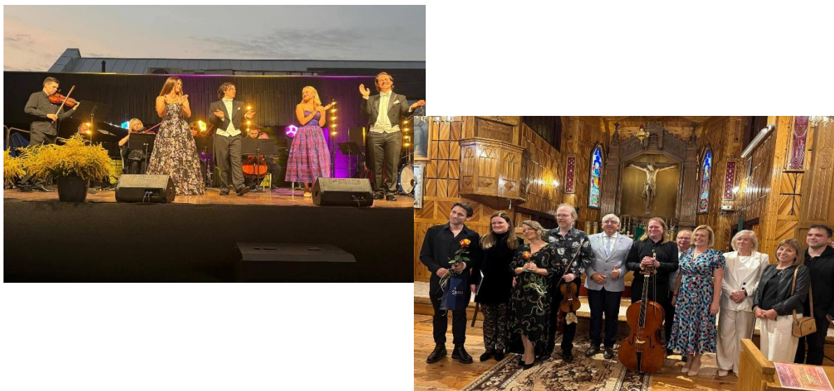
Klasyczne koncerty w Gminie Sarnaki - koncert plenerowy w Sarnakach i koncert w Serpelicach