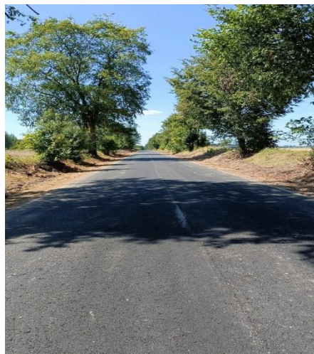
Droga powiatowa nr 2012W Chybów - Litewniki Stare - Walim - Nowa Kornica