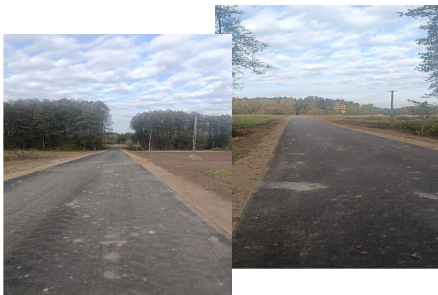
Droga gminna nr 200527W w miejscowości Hołowczyce - Kolonia

Zadanie zostało zrealizowane w ramach dotacji z Samorządu Województwa Mazowieckiego ze środków pochodzących z wyłączenia gruntów z produkcji rolnej w wysokości 173 154,17 zł. Wartość całkowita zadania wyniosła 437 388,00 zł.