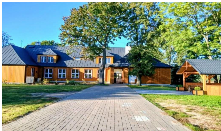
Budynek Dziennego Domu Senior+ w Nowych Hołowczycach

Wartość całkowita zadania wyniosła 395 501,75 zł, z czego 250 000,00 zł pochodziło ze środków Rządowego Funduszu Polski Ład: Program Odbudowy Zabytków.