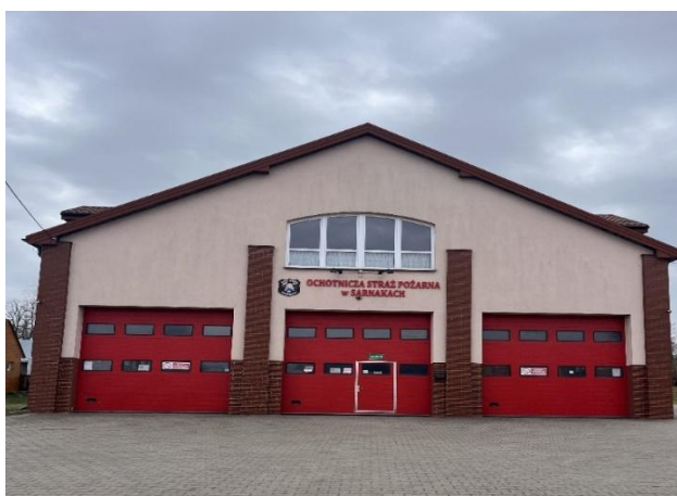
Bramy garażowe w budynku OSP Sarnaki

Wartość projektu wyniosła 40 467,00 zł, z czego aż 40 000,00 zł stanowiło dofinansowanie.